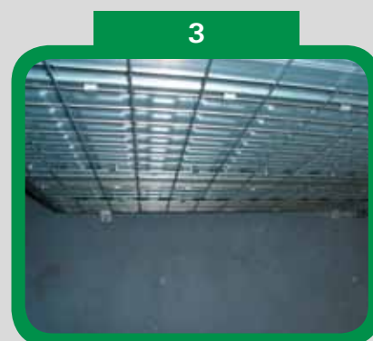
Ukotvěte stavební pouzdro do podlahy