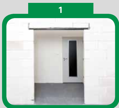
Připravený stavební otvor