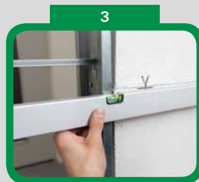
Usaďte pouzdro dle „vágrysu“