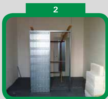
Postavené a vyvážené pouzdro