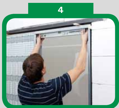
Vyvažte stavební pouzdro horizontálně a vertikálně