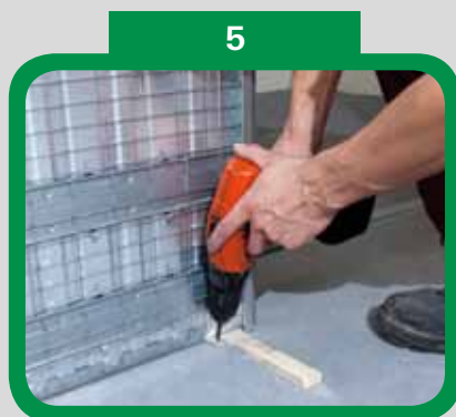
Ukotvěte stavební pouzdro do podlahy