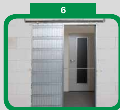
Zapěněné pouzdro ve stavebním otvoru