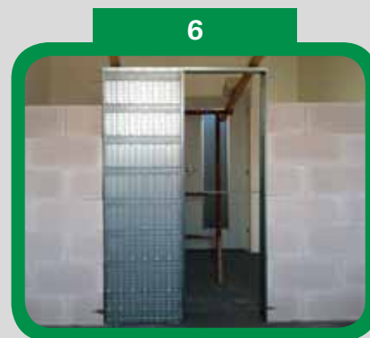
Zazděné stavební pouzdro v příčce (Pozor - nad pouzdrům musí být překlad)